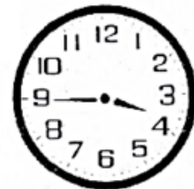
เรือนที่ 2

จากข้อมูล เวลาของนาฬิกาเรือนที่ 1 ต่างจากเวลาของนาฬิกาเรือนที่ 2 กี่ชั่วโมง กี่นาที